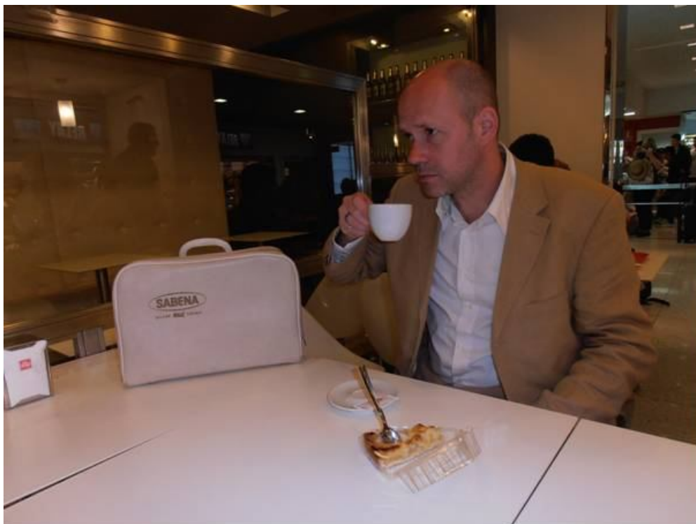
Lichte teleurstelling na het gesprek met de Confederación Española de Gremios y Asociaciones de Libreros.